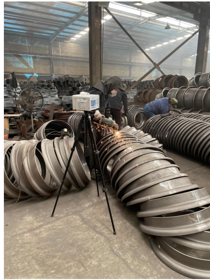
叉车线轮辋车间/打磨岗