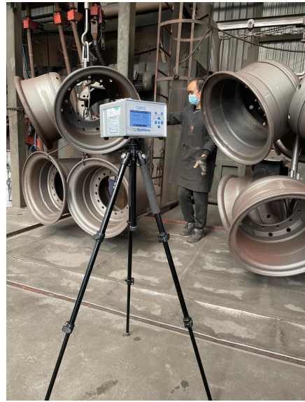
工程线轮辋车间/抛丸岗