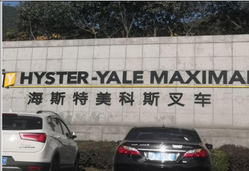
技术服务过程影像